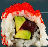
TUNA AVOCADO ROLL 190 g

[castravete, mango, dulceață mango, orez, ton, wasabi, algă nori, soia, ginger, bambus.]