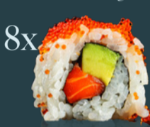
SALMON AVOCADO ROLL