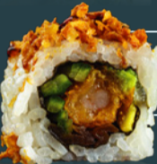
CALIFORNIA ROLL 210 g

[icre de somon*, orez, somon, philadelphia, avocado, castravete, wasabi, algă nori, soia, ginger, bambus.]