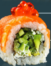
PHILADELPHIA ROLL 250 g

[crevete torpedo*, anghila*, orez, castravete, somon, avocado, wasabi, algă nori, soia, sos unaghi, maioneză picantă, ginger, bambus.]