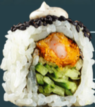
SHRIMP TEMPURA ROLL 200 g

[somon, ceapă verde, kimchi, orez, avocado, făină tempura, panko, ulei susan, maioneză picantă, wasabi, algă nori, soia, ginger, bambus.]