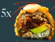
SPICY TUNA ROLL