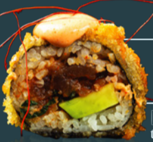
SPICY TUNA ROLL 200 g

[crevete torpedo*, castravete, avocado, dovlecel kanpyo, orez, unagi, wasabi, algă nori, soia, ginger, ceapă caramelizată, bambus.]