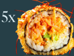
SPICY SALMON ROLL