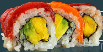
RAINBOW ROLL 180 g

[avocado, orez, castraveți, dovlecel kanpyo, alge, sos unaghi, soia.]