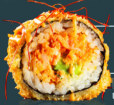
SPICY SALMON ROLL 200 g

[ton, ceapă verde, kimchi, orez, avocado, făină tempura, panko, ulei susan, maioneză picantă, wasabi, algă nori, soia, ginger, firicele chilli, bambus.]