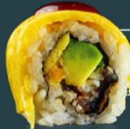
UNAGI ROLL 210 g

[creveți tempura*, castravete, orez, susan, avocado, maioneză cu trufe, wasabi, algă nori, soia, ginger, bambus.]