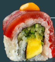
TUNA ROLL 210 g

[anghilă*, mango, orez, avocado, sos unagi, wasabi, algă nori, soia, ginger, bambus.]