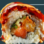
DRAGON ROLL 250 g

[Orez, sparanghel, avocado, mușchi de vită*, ulei susan, ficat rață, sos unagi, maioneză picantă, wasabi, ginger, soia, frunză bambus.]