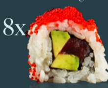
TUNA AVOCADO ROLL