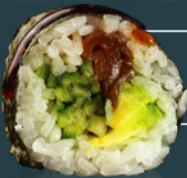
VEGETARIAN ROLL 390 g

[ton, avocado, orez, icre red*, wasabi, algă nori, soia, ginger, bambus.]